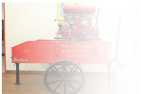
Alte Tragkeitspitze der Feuerwehr