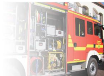
Neues Löschfahrzeug der Feuerwehr