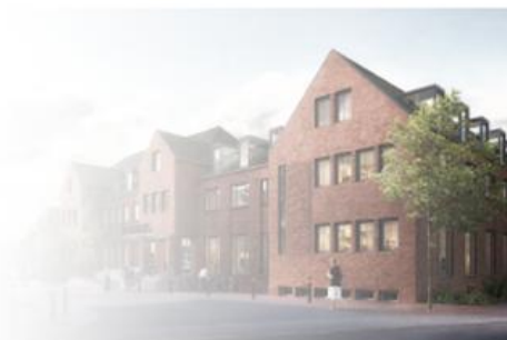
Visualisierung Rathaus-Umbau (Arbeitsgemeinschaft Feldhaus+Elkemann Architekten)