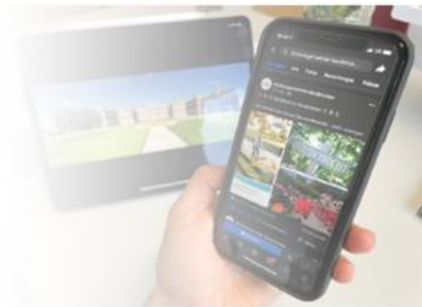
Facebook-Auftritt der Gemeinde Nordkirchen