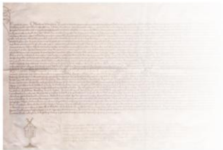
Reinmod-Urkunde „Gründungsdocument“ der Gemeinde Nordkirchen