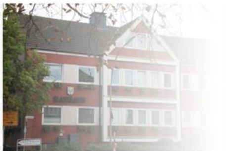
Ansicht altes Rathaus